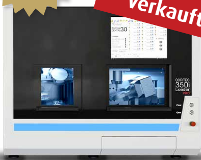
Coritec 350i Loader PRO+