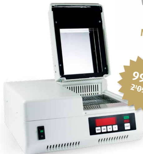
NK Optik Othoflash