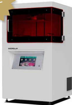
Microlay Versus 385 + Material im Wert von 1'000.-