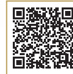
NextDent LC-3D Printbox