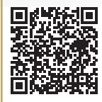
Microlay Eve + Material im Wert von 1'000.-