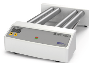
LC-3DMixer Abroll- / Kippvorrichtung zum Mischen von 3D-Druckmaterialien