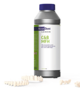
C&B MFH 3D-Druckmaterial für mikrogefüllte Kronen und Brücken