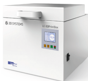
LC-3DPrint Box Nachhärtungseinheit mit hoher Kapazität