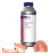
Denture 3D+ 3D-Druckmaterial für den Druck der Basen von Vollprothesen