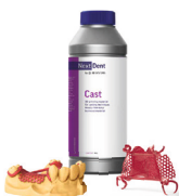
Cast 3D-Druckmaterial für Gießverfahren, leicht und rückstandsfrei ausbrennbar