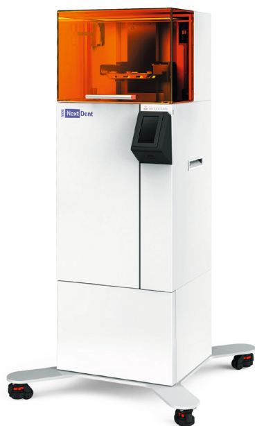
NextDent™ 5100 NextDent™ 5100 3D-Drucker mit Verwendung mit der Figure 4-Technologie